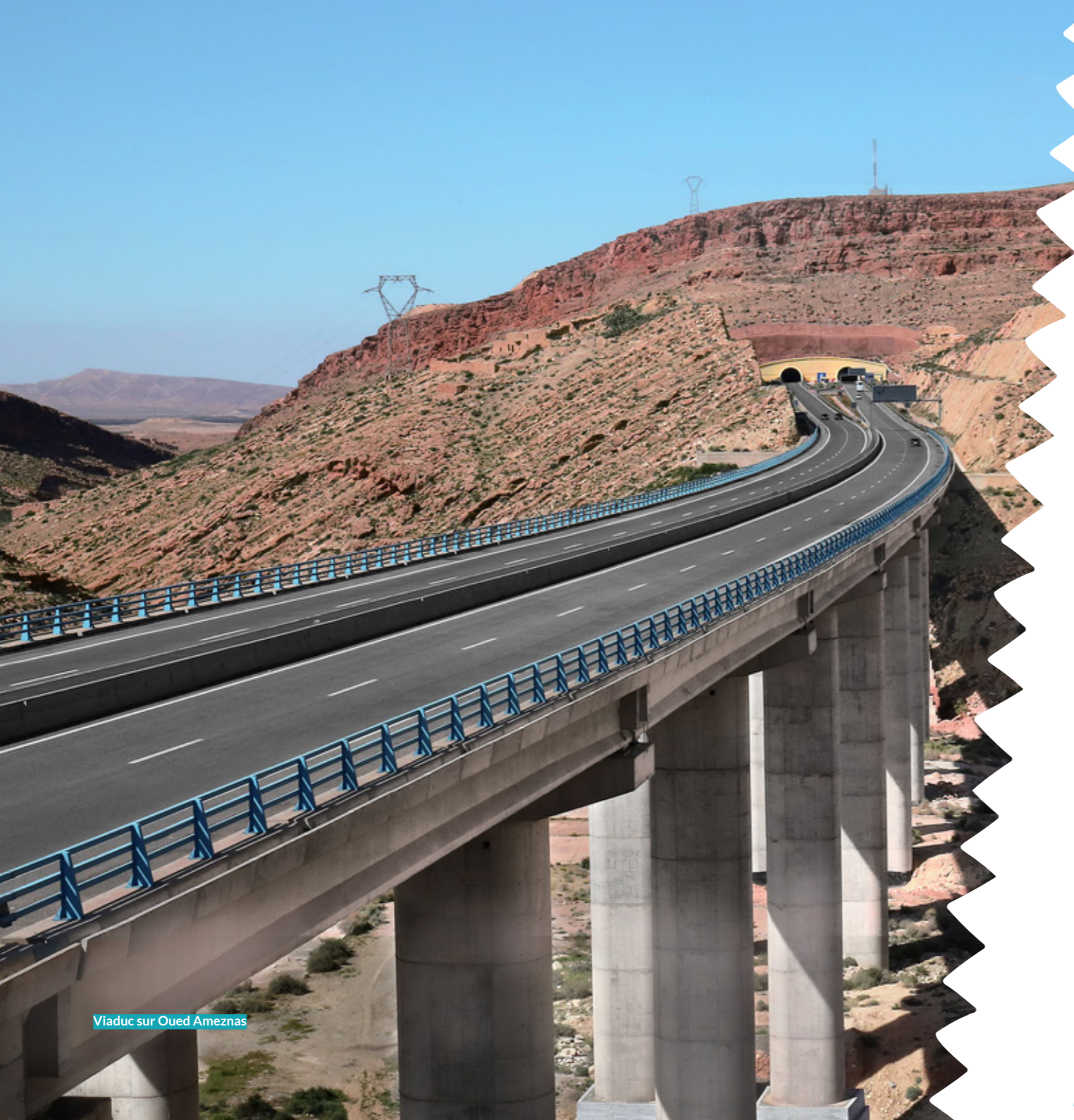
Viaduc sur Oued Ameznas