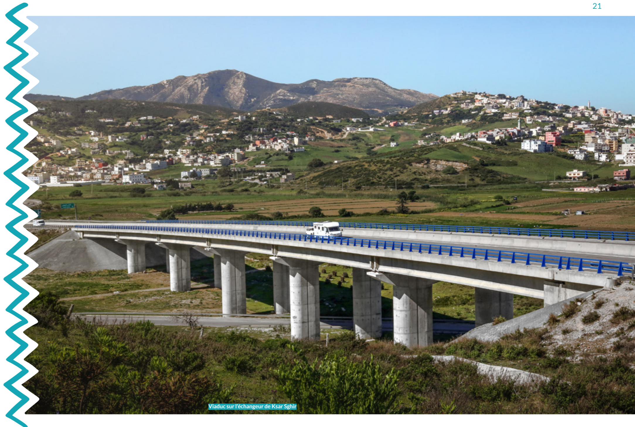
Viaduc sur l'échangeur de Ksar Sghir