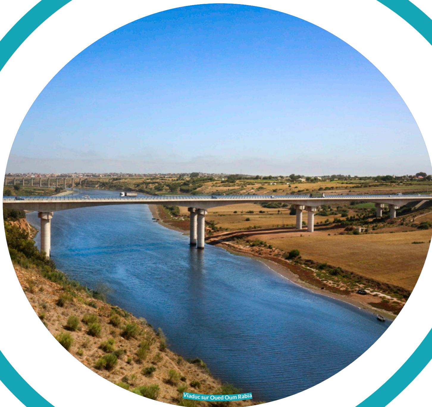
Viaduc sur Oued Oum Rabia