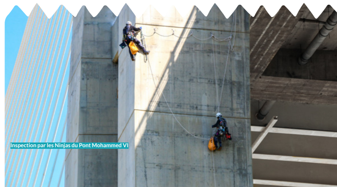
Inspection par les Ninjas du Pont Mohammed VI