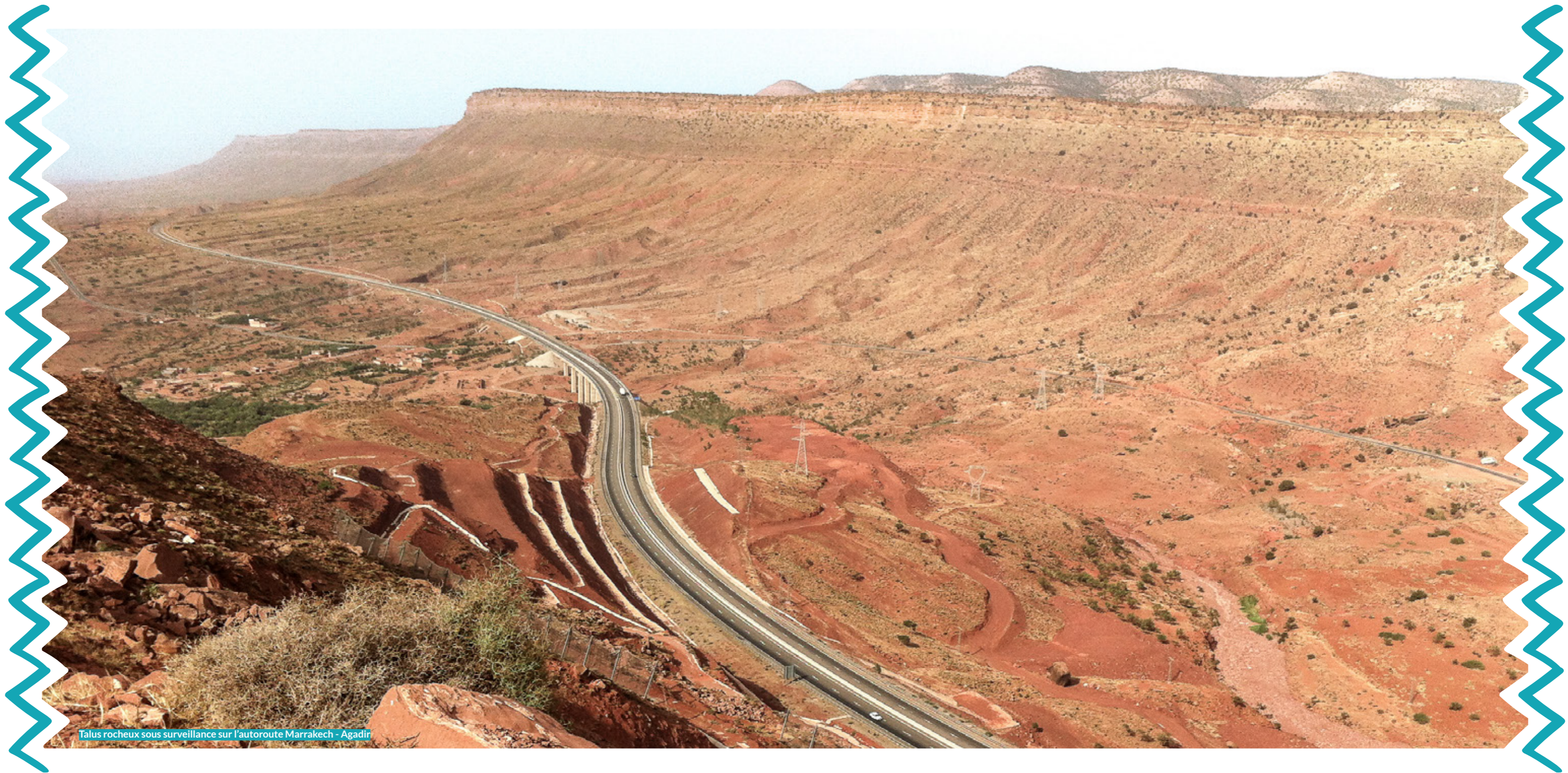
Talus rocheux sous surveillance sur l'autoroute Marrakech - Agadir