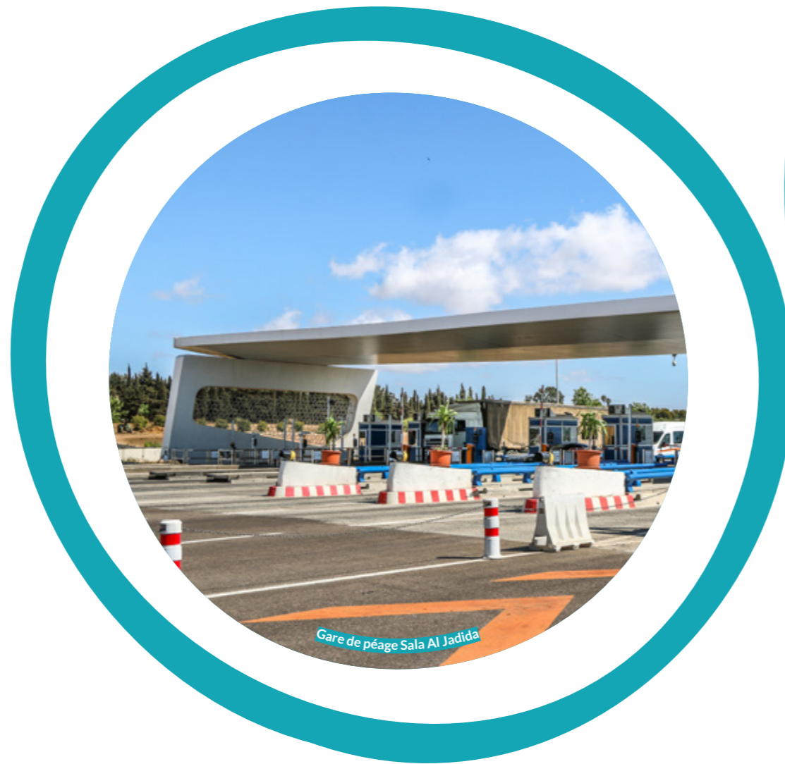
Gare de péage Sala Al Jadida

- Dans le cas de l'annulation de la participation d'un stagiaire à la formation, ce dernier doit restituer le billet d'avion avant la date limite prescrite par l'agence du voyage, à défaut de cette restitution, les frais du billet d'avion seront supportés par l'organisme employeur.