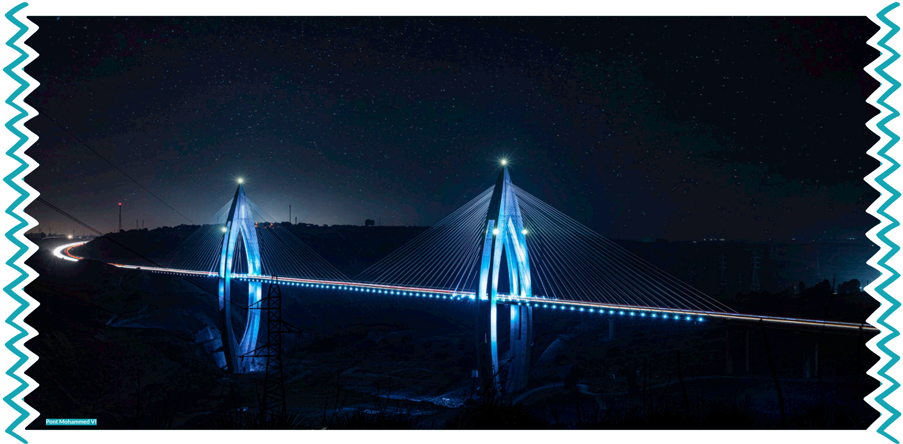
Pont Mohammed VI