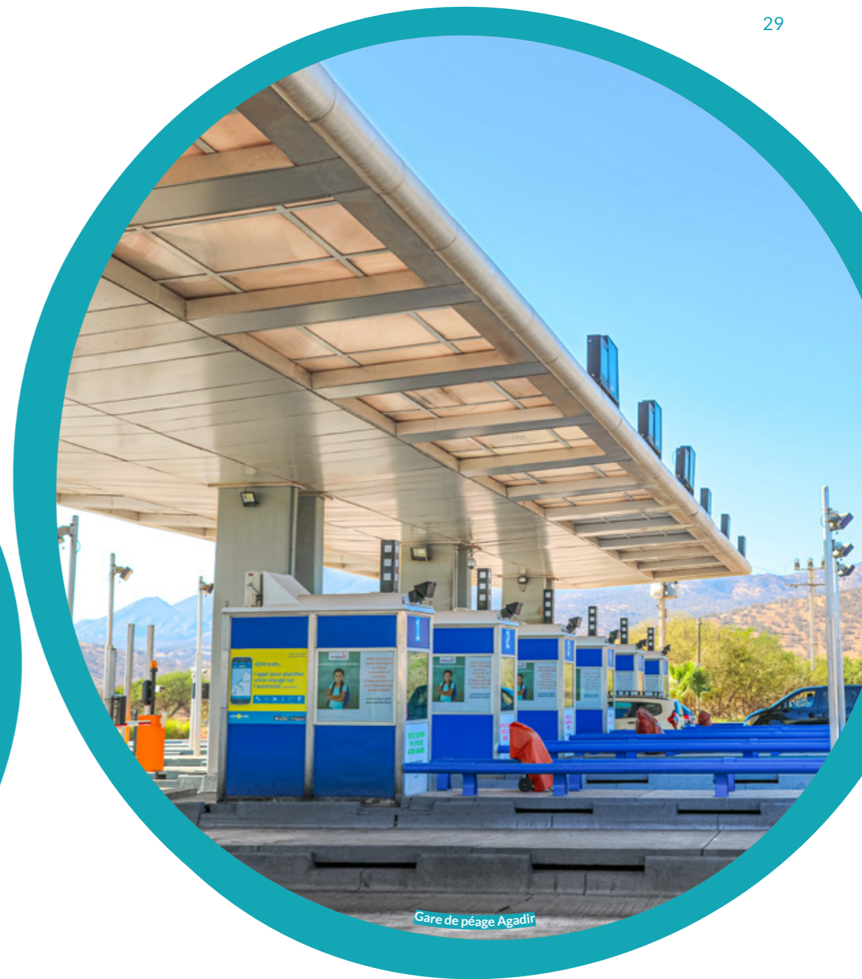
Gare de péage Agadir