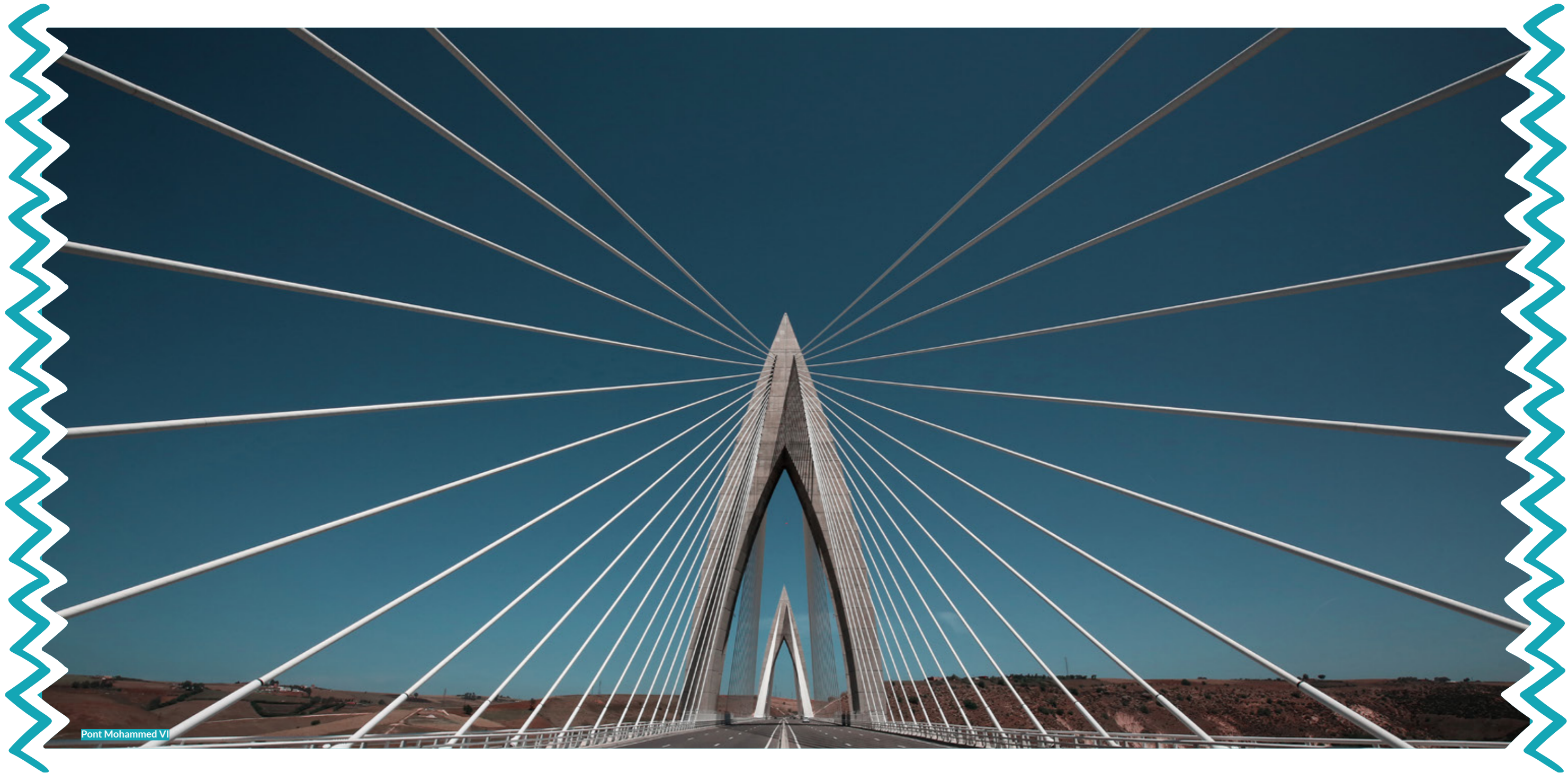
Pont Mohammed VI