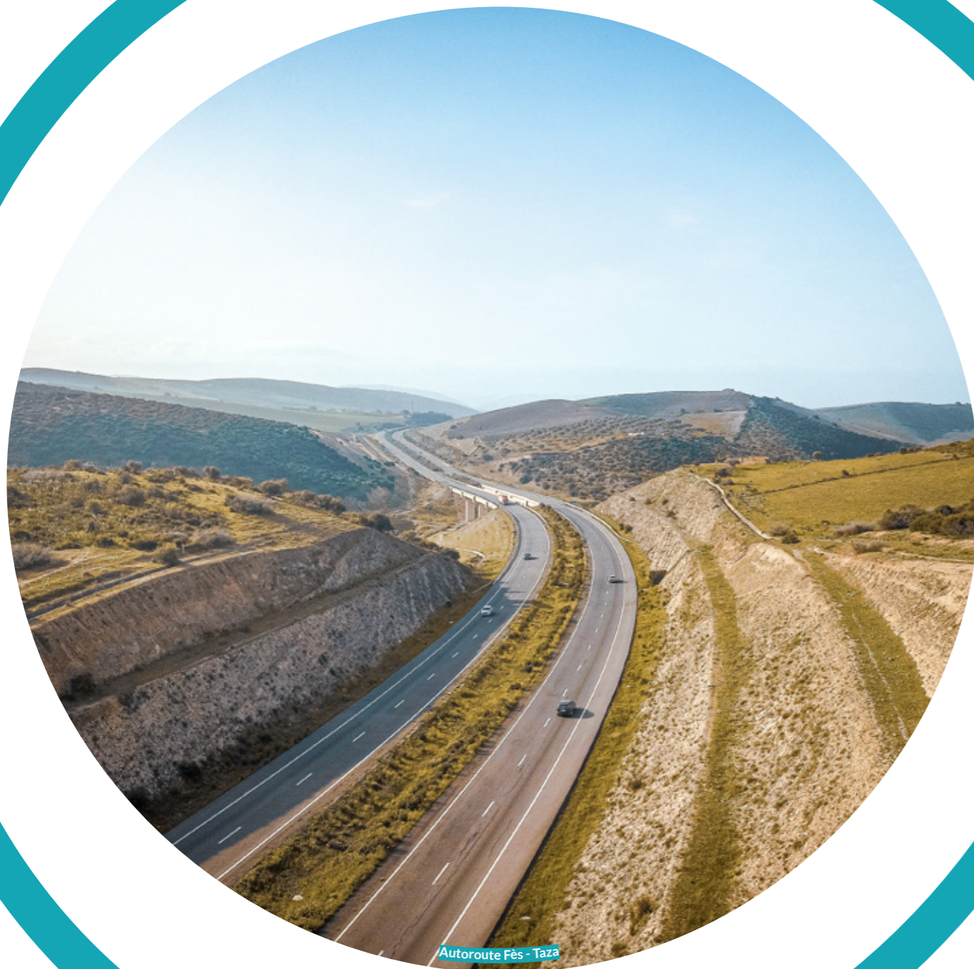
Autoroute Fès - Taza