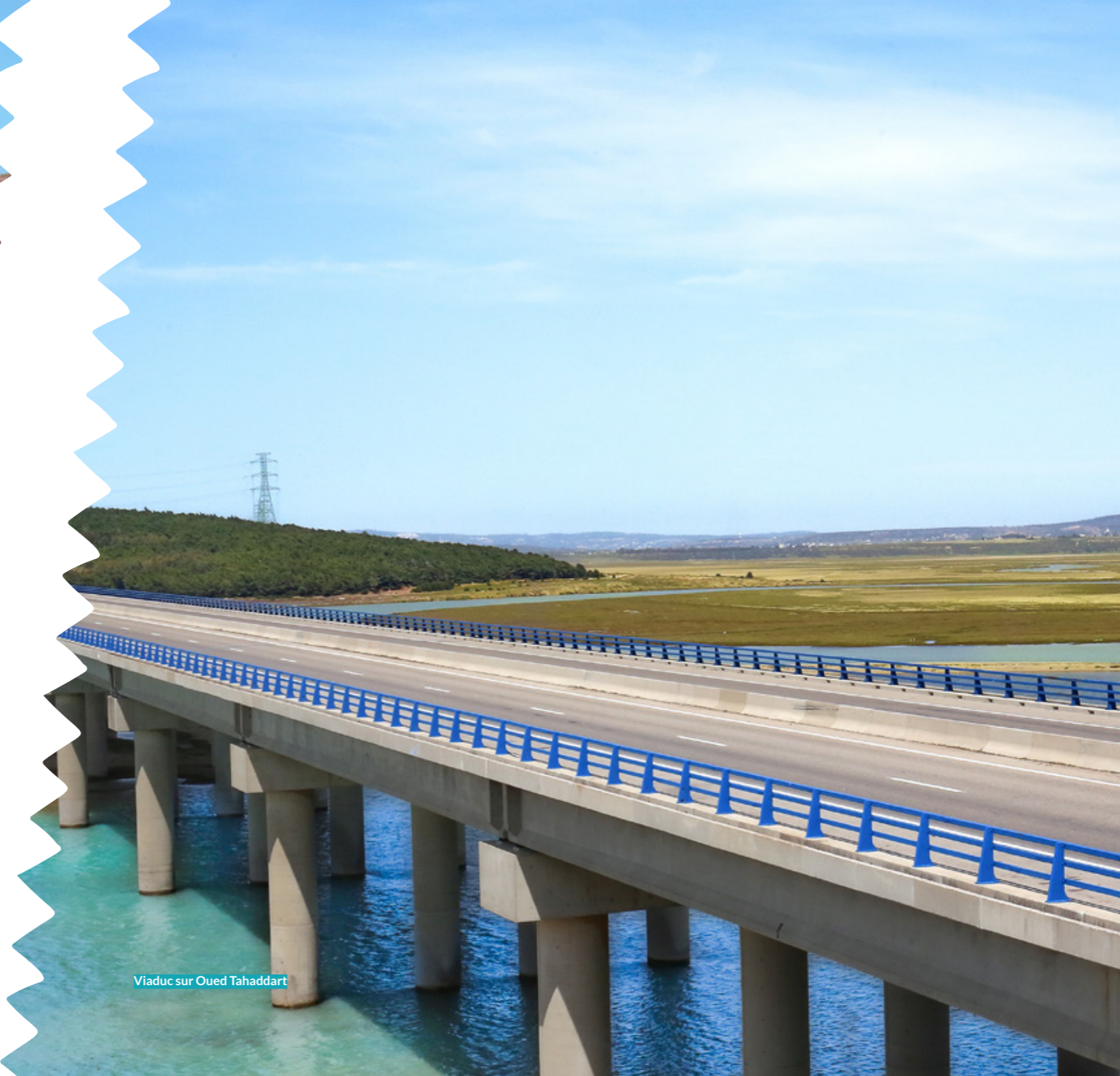
Viaduc sur Oued Tahaddart