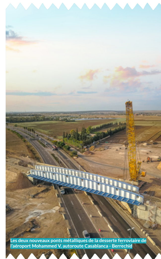
Les deux nouveaux ponts métalliques de la desserte ferroviaire de l'aéroport Mohammed V, autoroute Casablanca - Berrechid